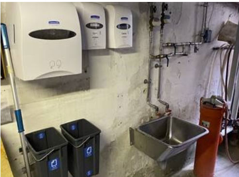
2. Arbejdsstation i varmekælder

Udarbejdet af Dion Madsen – ejendomsleder i Kanslergården og Østerbrogade 95.